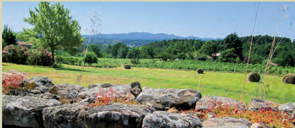
Weite Blicke über Wiesen und Weinfelder zu den Ardèche-Bergen

einen Steg und nach links am Bach entlang. Auf schmalen Weg, mal über Steine, mal über kleine Brückchen kreuzt man nun wunderschön mehrfach den kleinen Bach ( toller Wegabschnitt für Kinder ). Nach knapp 500 m geht nach einem breiteren Steg