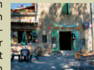
Café du Platane

In einer scharfen Rechtskurve einige Meter nach links und dann rechts in den Fahrweg Richtung Mas Gauthier gehen. Der bald erreichten Straße leicht abwärts folgen. Nach einer Kurve in den Schotterweg vor dem Neubaugebiet nach links abbiegen und auch noch geradeaus über eine Wegkreuzung hinweg leicht abwärts gehen. Einer kleinen Straße nach links und direkt wieder nach rechts der Durchgangsstraße bis kurz vor Montréal folgen. Man verläßt nun die gelb-weiße Markierung, biegt leicht links in die Straße ab und gelangt durch den sehenswerten Ort zurück zum Ausgangspunkt.