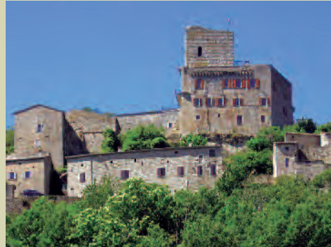
Château de Montréal, im 12. Jahrhundert als Schutzburg für Largentière erbaut.

Von dem Café du Platane geht man nach rechts bis zum Dorfplatz. Gegenüber des kleinen Kriegerdenkmals geht nach links eine schmale Gasse ab und führt zwischen den Häusern hindurch. Die gelb-weiße Markierung ist erst etwas weiter hinten zu finden. Der Weg führt als etwas verwachsener Pfad zwischen den Trockenmauern abwärts. Vor einem Zaun scharf nach links abbiegen (Achtung: nicht weiter geradeaus) und am Ende des Zauns nach rechts dem Pfad folgen. Der Wanderweg geht in eine kleine Straße über, die man einige hundert Meter bis zu einer scharfen Linkskurve nimmt und geradeaus auf schmalen Pfad wieder verläßt. Nach einer Linkskurve erreicht man ein Gartentor, das man durchquert und der dann erreichten Straße nach rechts abwärts über eine Brücke folgt. Nach der Brücke nach rechts auf den oberen schmalen Pfad an der Mauer entlang abbiegen. Nach 50 m leicht links eine kurze Treppe hinauf und 20 m weiter den links ansteigenden Pfad nehmen. Im Kiefernwald biegt der Weg nach 50 m scharf links aufwärts ab. Der Weg zieht sich wunderschön an Obstplantagen und Weinfeldern entlang – bis zu einem Abzweig nach rechts Richtung Laurac . Der bald erreichten Straße folgt man nach rechts, vorbei an einem Weinfeld. Nach 50 m weiter aufwärts scharf links in den Pfad entlang einer Mauer abbiegen. Geradeaus vor-